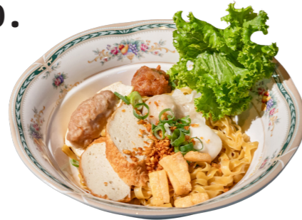
10. BHA MEE POR บะหมี่เปี๊ยะ ลูกชิ้นแคะ

Dry flat egg noodles, fish balls, tofu stuff, fry pork minced ball