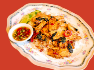
KRAPOW W RICE

$5 UPGRADE TO HOUSE WINE | HOUSE BEER | HOUSE SPIRITS