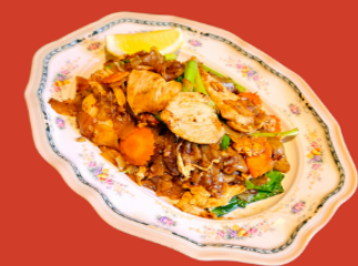
PAD SI - EW