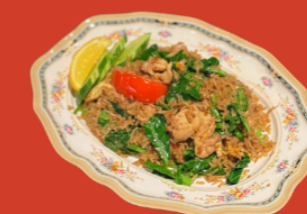
THAI FRIED RICE