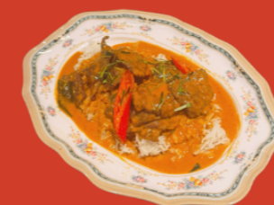
PANANG CURRY W RICE