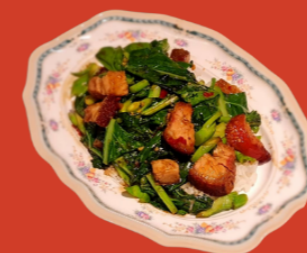
STIR FRIED CHINESE BROCCOLI W RICE