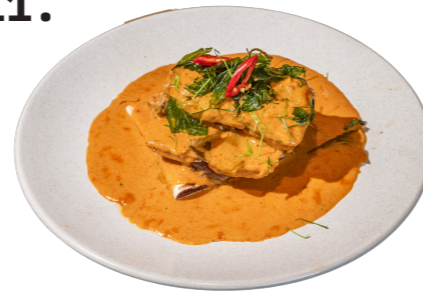
11. PANANG CURRY พะแนงซี่โครงเนื้อ+ข้าว

Panang curry sauce, stew beef ribs with rice