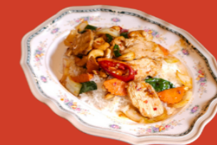
STIR FRIED CASHEW NUT W RICE