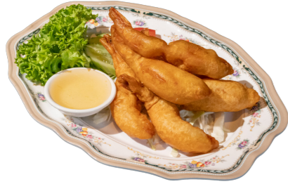
9. PRAWN 90'S กุ้งชุบแป้งทอด