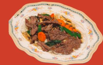
STIR FRIED OYSTER SAUCE W RICE